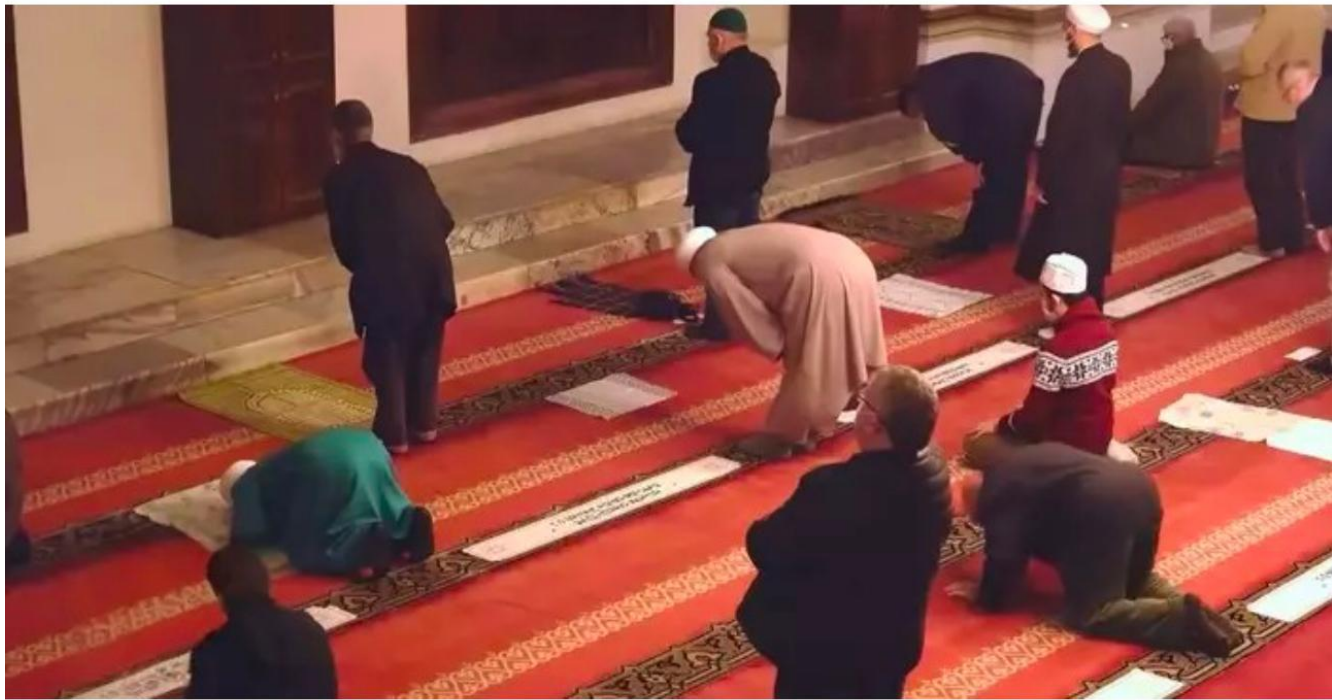
伊朗5萬間清真寺關閉。（圖 / YouTube@CBNNews影片截圖）